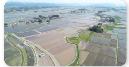
■下福田地区：整地後(R4)