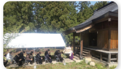
■朴田荒処地区：安全祈願