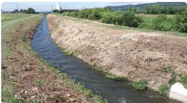
施工前の張りブロック水路の状況