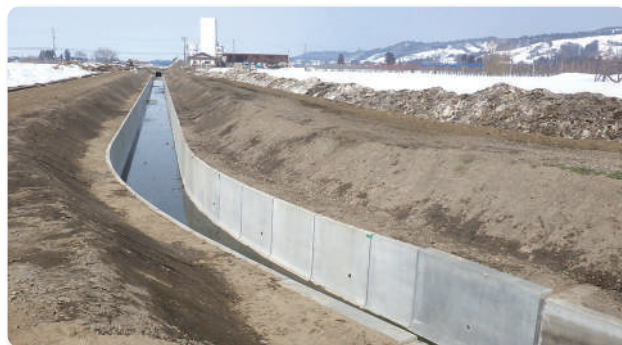
コンクリートフリューム水路に改修しました