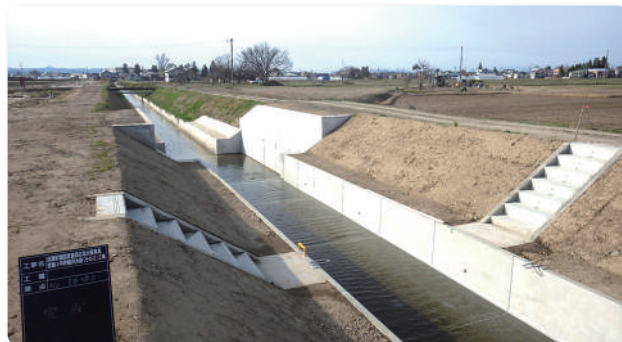
コンクリートフリューム水路に改修しました

工事期間中、地域の皆様には大変ご不便をおかけしますが、ご理解とご協力をよろしくお願いいたします。