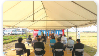
■平鹿蟹沢地区：安全祈願