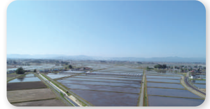
■平鹿高口地区：整地後(R4)