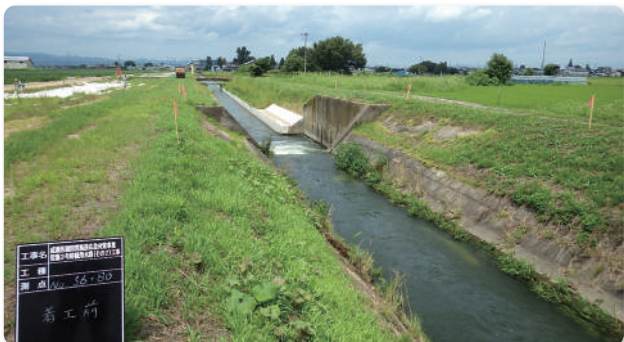
施工前の張りブロック水路の状況