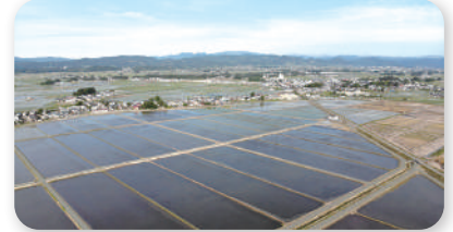
■浅舞北部地区：整地後(R4)