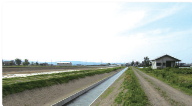
コンクリートフリューム水路に改修しました

工事期間中、地域の皆様には大変ご不便をおかけしますが、ご理解とご協力をよろしくお願いいたします。