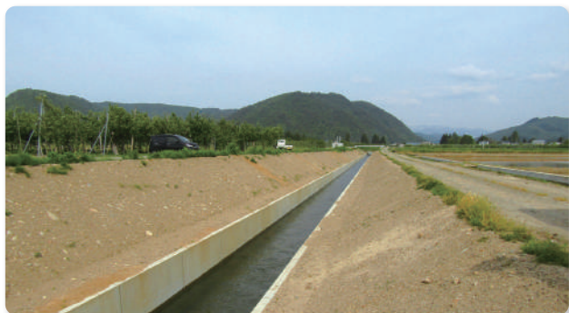
コンクリートフリューム水路に改修しました