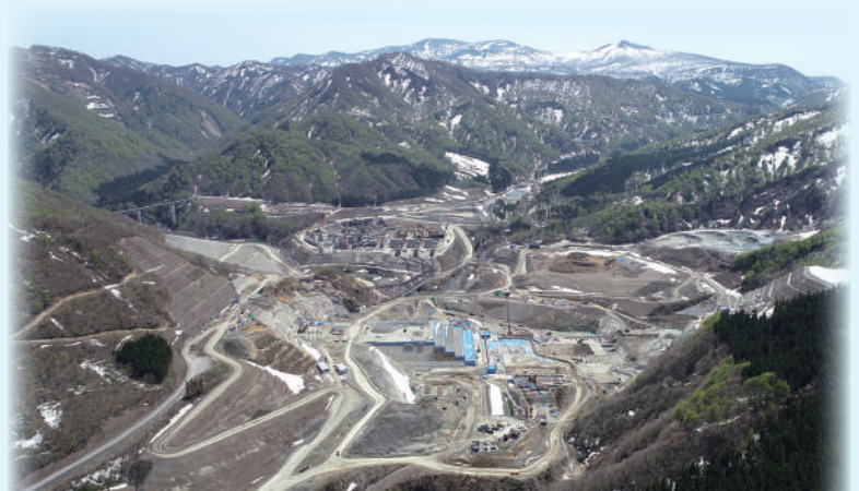
成瀬ダム 定礎式(万歳三唱、鎮定の儀)