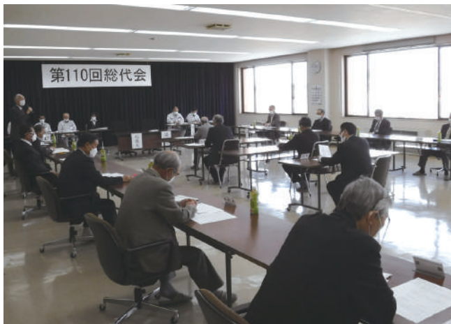
書面議決による総代会の様子

新型コロナウイルスの感染の状況を踏まえ、令和4年3月25日に第110回通常総代会を書面議決による開催といたしました。令和4年度予算及び定款の一部変更など全14議案について、全議案原案の通り承認及び可決されました。