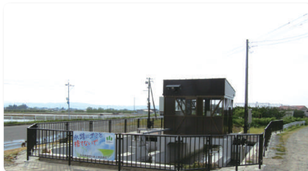
建屋と柵を改修しました