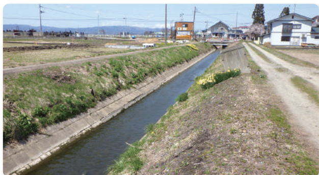
施工前の張りブロック水路の状況